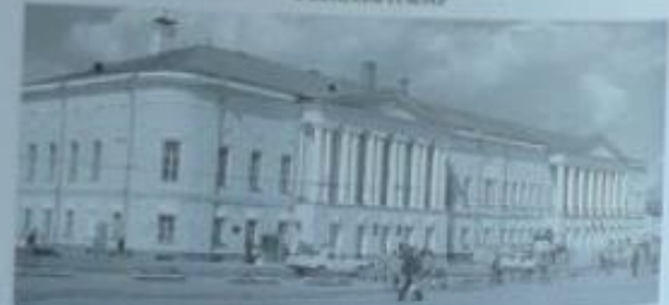
Владивосток. Сюда забрал на службу Горький