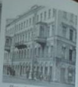
Петербург. Большая Морская. Здесь жил Горький в 1880-1881 годах