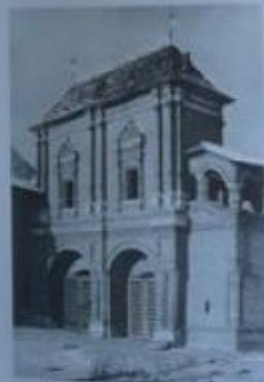
Кутузовский мост (бывшее казармы), где содержали Герцена