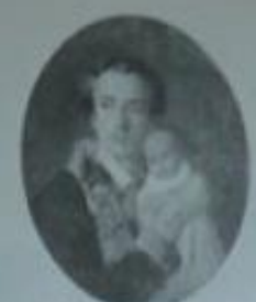
Горький с матерью, 1840 год