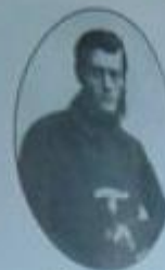
Иван Виссарионович Киреевский