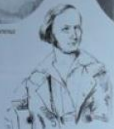
Александр Герцен в 1841 году