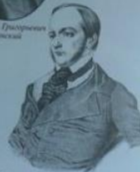
Александр Николаевич Герцен