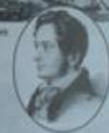
Портрет Горького работы А.И. Вайнберга, 1836 год