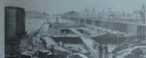
Казань. Волжский мост