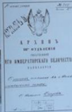
«Дело и лица, вошедшие в историю Герцена в Москве»