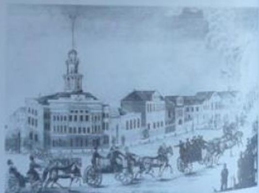
Причистенская пожарная часть, где сидел под арестом Герцен