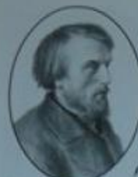
Виссарион Григорьевич Белинский