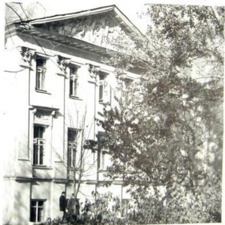
Дом, где родился Горький. — Тверской бульвар, 25. Теперь здесь Литературный институт имени Горького