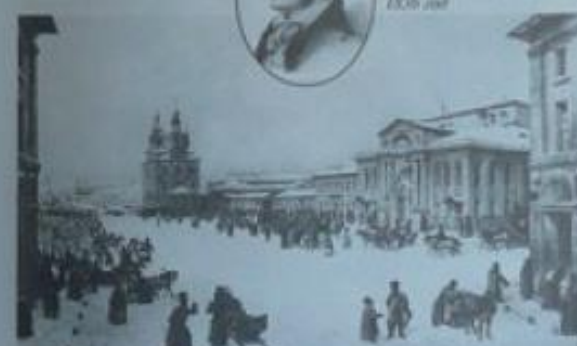
Москва. Мясницкая. Стрелка — Дворянское собрание (Дом Сокола)