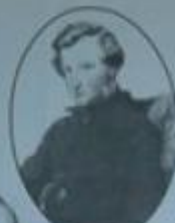
Юрий Федорович Самарин