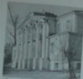
Ялта. В этом здании Горький жил в 1835-1837 годах