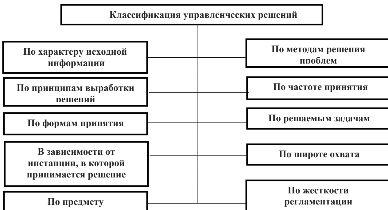
Рис. 1. Классификация управленческих решений

Пример оформления рисунка представлен ниже (рисунок 1).