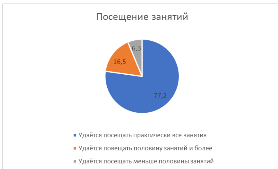
Рис. 2. Посещение занятий (в % от общего числа опрошенных )

Обобщенные данные в целом по филиалу показывают, что большая часть опрошенных (77,2%) отмечают, что им удаётся посещать практически все занятия.