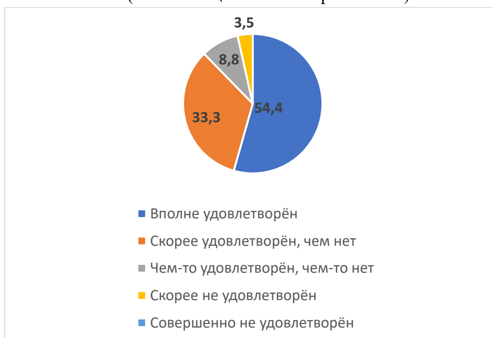
Степень удовлетворённости преподавателей материально-технической оснащённостью филиала (в % от общего числа опрошенных)