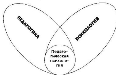
Рис. 1. Взаимосвязь педагогики и психологии

Формула - текст, представляющий собой комбинацию специальных знаков, выражающую какое-либо предложение (ОСТ 29.130-97).