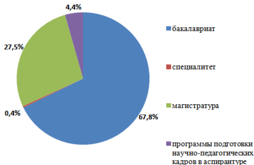
Рисунок 2. Структура контингента обучающихся по уровням высшего образования

Стратегические изменения в реализации образовательных программ высшего образования за отчетный период достигались путем решения следующих задач: