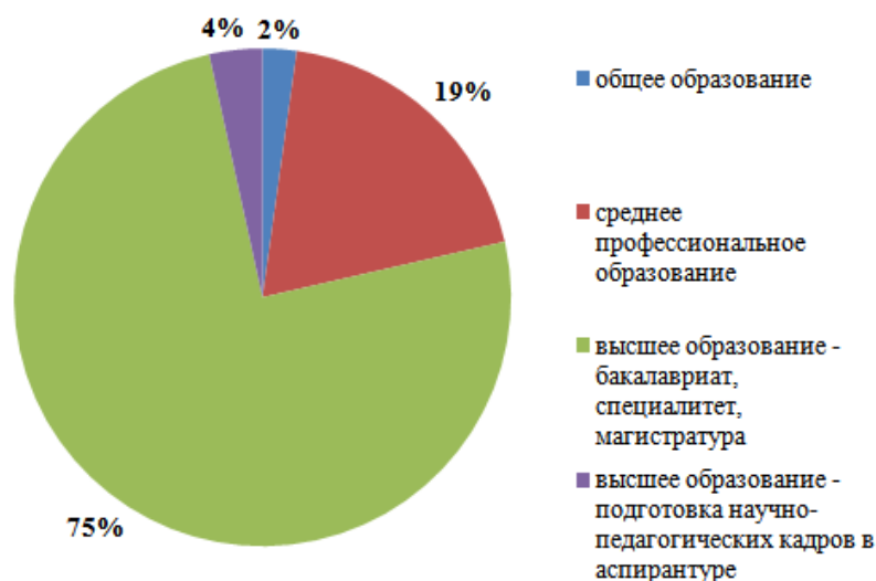
Рисунок 1. Распределение контингента обучающихся по реализуемым уровням образования

Распределение контингента по реализуемым уровням образования представлено на рисунке 1.